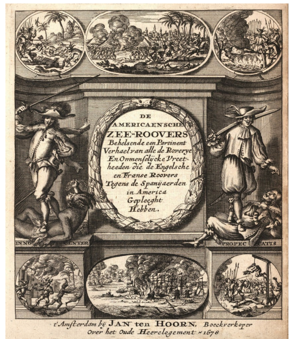
Fig. 15. Portada de la obra de Alexandre Exquemelin De Americaensche Zee-Rovers . (Amsterdam, Jan ten Hoorn, 1678) en la que se describen los crímenes y atrocidades cometidos por los filibusteros ingleses y franceses, incluyendo a Henry Morgan en los mares de la América española.