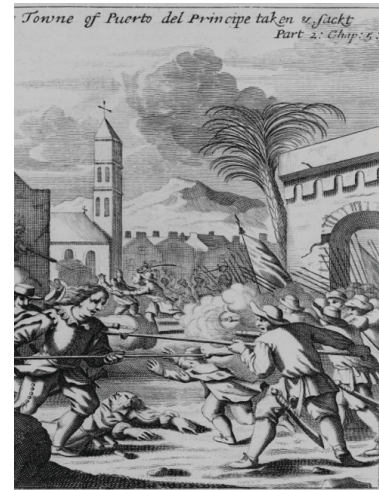
Fig. 6. Ilustración, de autor desconocido, del saqueo de Puerto Príncipe de 1668 por Henry Morgan. (The Project Gutenberg eBook, On the Spanish Main , de John Masfield, 1939).

dieran detallar todos los planes en curso, si es que los hubiera. El temor de Modyford era fundado, pues ese año ya se había producido alguna que otra incursión de buques españoles a lo largo de la línea de costa.