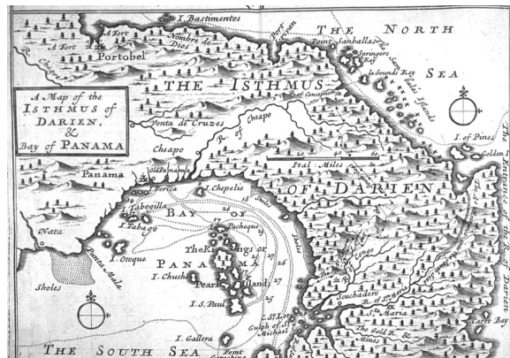
Fig. 10. Mapa del istmo de Darién y Panamá, de Herman Moll, publicado en la obra de William Dampier A New Voyage Round the World (Londres, James Knapton, 1697).

De entre las extensas plantaciones de Henry Morgan destacó la finca Lawrencefield, en St. Elizabeth Parish, cultivada principalmente con caña de azúcar y operada por más de cien esclavos. No