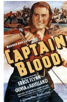
Fig. 17. Portada de la novela de Rafael Sabatini Captain Blood (Boston: Houghton Mifflin, 1922), inspirada en la biografía de Henry Morgan, y cartel de la película de 1935, producida por Warner Bros, basada en la novela homónima, dirigida por Michael Curtiz y protagonizada por Errol Flynn y Olivia de Havilland.