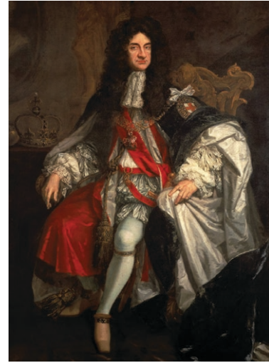
Fig. 5. Retrato al óleo del rey Carlos II de Inglaterra (1685), obra de Godfrey Kneller. (Colección Walker Art Gallery, Museos Nacionales de Liverpool).

Poco antes de que tales movimientos políticos se sucedieran, en 1668, llegó a oídos de Modyford, a través de sus redes de espionaje, el rumor de que los españoles se aprestaban a invadir y recuperar Jamaica con una flotilla que zarparía desde la isla de Cuba. Dado que carecía de protección naval suficiente para resistir un ataque de estas características y no disponía de suficiente información, el gobernador ordenó a los corsarios bajo su control que realizasen una incursión de castigo en Cuba a fin de capturar prisioneros españoles que pu-