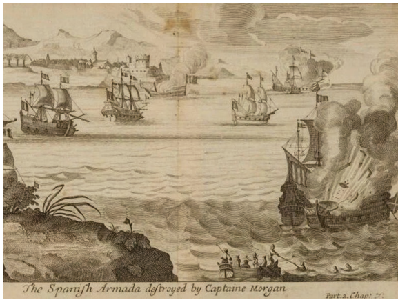
Fig. 16. Ilustración de autor desconocido de la destrucción de la Armada Española de Barlovento por Henry Morgan en Maracaibo, en 1669, publicada en la edición de 1684 de la obra The Buccaneers of America... de Alexandre Exquemelin (Londres: William Crooke).