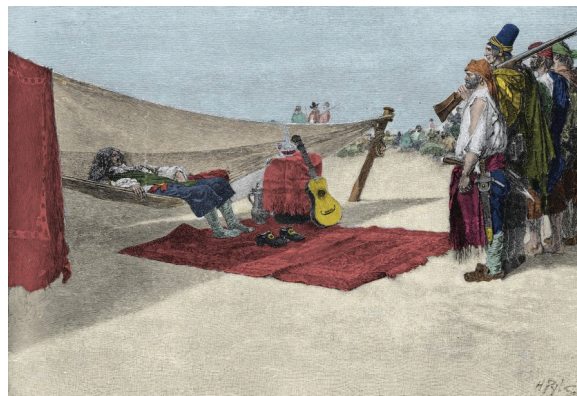
Fig. 11. El pirata Sir Henry Morgan reclutando hombres para el ataque a Panamá alrededor de 1670. Ilustración de la obra de Howard Pyle Buccaners and Marooners of the Spanish Main (New York: Harper & Brothers, 1921).