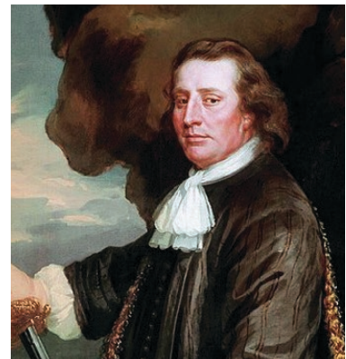
Fig. 3. Retrato al óleo del vicealmirante Sir Christopher Myngs (1665), obra de Peter Lely. (Colección del Museo Marítimo Nacional, Museos Reales de Greenwich, Londres).