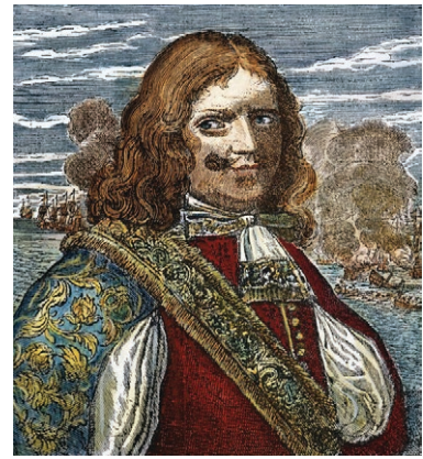
Fig. 1. Retrato coloreado de Henry Morgan, basado en un grabado del libro de Alexandre Olivier Exquemelin Piratas de América del siglo XVII (Colonia Agripinna: Casa de Olenzo Struickman, 1681).

Myngs, en concreto, fue una figura clave en la transformación de los navíos bucaneros, habitualmente desorganizados, en fuerzas corsarias formales y bien estructuradas bajo objetivos comunes, estableciendo un modelo de acción que influyó notablemente en Henry Morgan, al que cabe considerar como su discípulo más aventajado. De hecho, las tácticas y autonomía de Myngs, tal cual luego sucedería con el propio Morgan, lo convirtieron en un personaje muy respetado por sus éxitos militares, pero también hartamente criticado por sus métodos agresivos y su excesiva independencia a la hora de tomar decisiones tácticas.