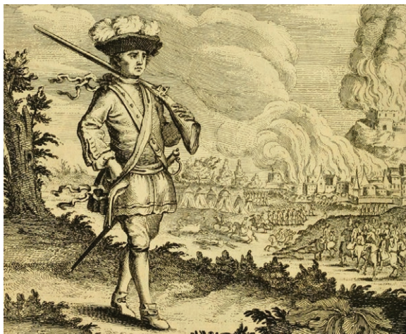
Fig. 13. Grabado realizado alrededor de 1736, en el que se muestra a Henry Morgan como un caballero durante el saqueo de la ciudad de Panamá, publicado en la obra del capitán Charles Johnson A general and true history of the lives and actions of the most famous bigbwaymen, murderers, street-robbers... (Birminghams: R. Walker, 1742).

El texto, considerado como la fuente original más importante sobre las actividades de los corsarios y bucaneros caribeños, se hizo harto popular y fue traducido al alemán (1679), español (1681), inglés (1684) y francés (1686), ampliándose en cada una de las versiones sucesivas que iban viendo la luz. Ni que decir tiene que la lectura de la edición inglesa, en la que se narraban con sumo detalle las torturas inferidas por Morgan a sus prisioneros durante el saqueo de Panamá, molestó sobremanera al cacique. Con todo, el corsario galés nunca pudo sofocar por completo las resonancias de su violento y controvertido pasado.