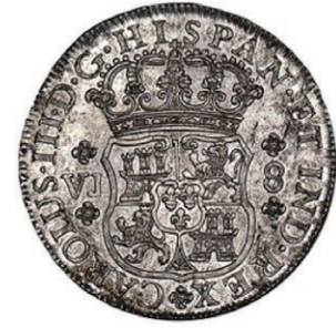
Fig. 8. Anverso de un real de a ocho acuñado en 1770 en la ceca de Bogotá.

encontró con un grupo de barcos franceses a cuyos tripulantes convenció mediante un futurible reparto del botín que se obtuviera para que se integraran bajo su mando, con lo cual la flota incursora alcanzó la cifra de setecientos hombres y adquirió proporciones considerables.