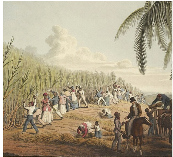
Fig. 14. Detalle de una plantación de caña de azúcar en las islas caribeñas británicas. Ilustración titulada Esclavos cortando caña de azúcar , publicada en la obra de William Clark Ten Views in the Island of Antigua . (Londres, Thomas Clay, 1823).

Finalmente, retirado de la vida pública en su plantación Lawrencefield, el influyente Morgan enfocó sus últimos años en actividades políticas esporádicas y en la administración de su hacienda. Murió el 25 de agosto de 1688, no está claro si por un edema cerebral o por complicaciones hepáticas, siendo enterrado en el cementerio de Palisadoes en Port Royal, camposanto que desapareció parcialmente por causa de un terremoto acaecido en 1692.