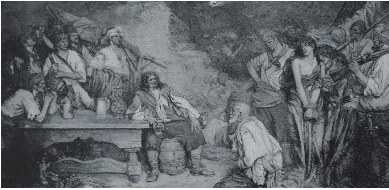
Fig. 7. Ilustración mostrando a Morgan con un prisionero, publicada originalmente en la obra de Howard Pyle Buccaneers and Marooners of the Spanish Main . ( Harper's Magazine , diciembre de 1888).