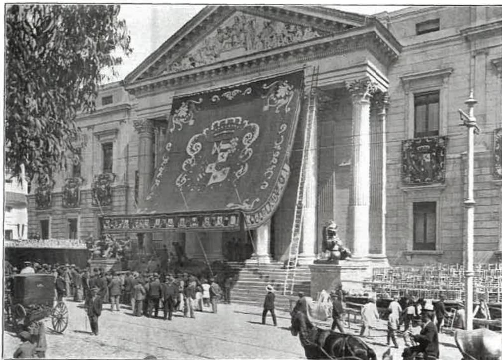
ASPECTO DEL CONGRESO DE LOS DIPUTADOS EN LA MAÑANA DEL DÍA DE LA JURA.