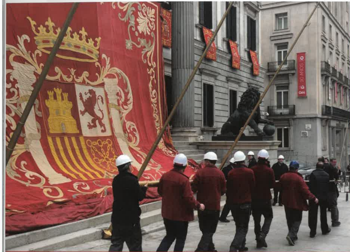
Dos momentos de la instalación de esta histórica pieza en la puerta principal del Palacio del Congreso