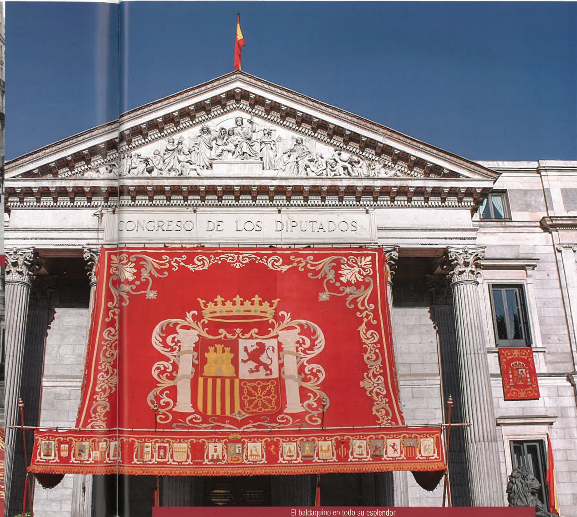
El baldaquino en todo su esplendor