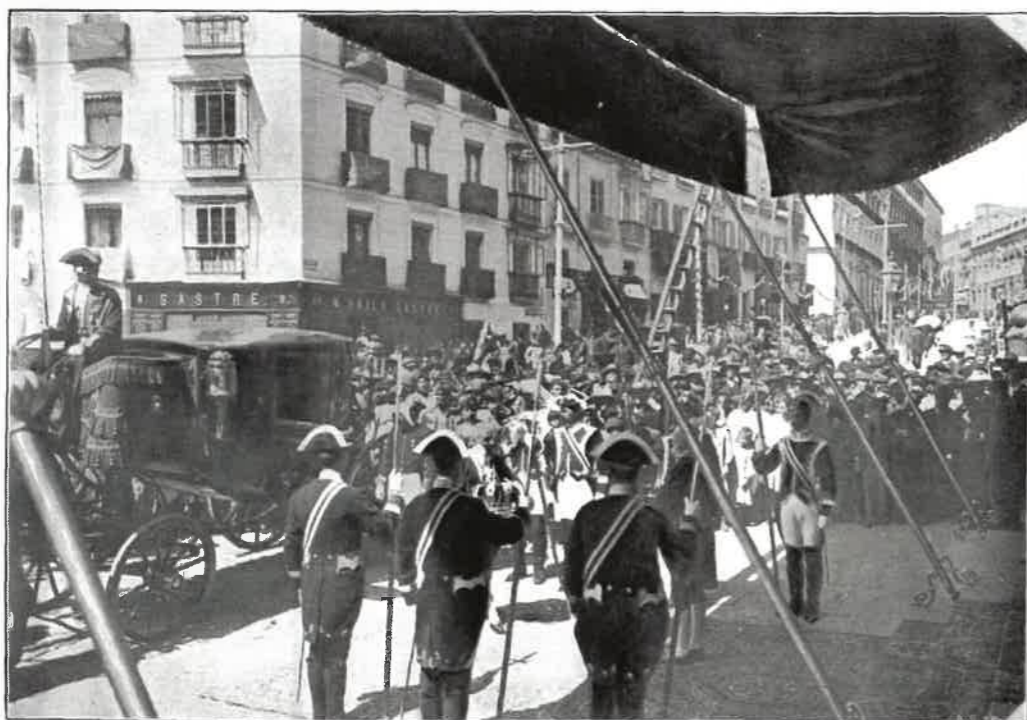
LLEGADA DE LAS INSENIAS REALES AL CONGRESO. LA JURA DE S. M. EL REY DON ALFONSO XIII.