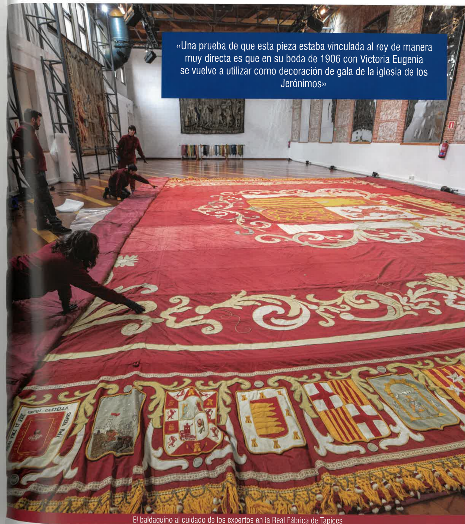
El baldaquino al cuidado de los expertos en la Real Fábrica de Tapices

«Una prueba de que esta pieza estaba vinculada al rey de manera muy directa es que en su boda de 1906 con Victoria Eugenia se vuelve a utilizar como decoración de gala de la iglesia de los Jerónimos»