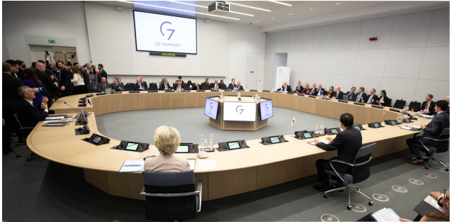
Reunión del G7 en el Cuartel General de la OTAN

El 24 de marzo se celebró una reunión de los líderes del G7 organizada por Alemania en el C.G. de la OTAN. A la reunión asistió el Secretario General de la Alianza y tuvo lugar tras la Cumbre celebrada el