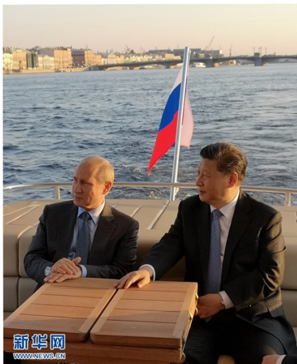
Putin y Xi Jinping por el río Neva en San Petesburgo en Junio 2019.

visita a Myanmar y días después ordenó el cierre de Wuhan. Hasta el pasado 8 de febrero de 2022, el presidente Xi, no mantuvo encuentro alguno en directo con ningún líder, salvo a través de teléfono y video llamadas. Rompió esa política para entrevistarse con Putin en Beijing al comienzo de los juegos olímpicos a primeros de febrero. Putin se mostró orgulloso de las relaciones entre su país y China y dijo que: “Nuestras relaciones bilaterales han progresado en un espíritu de amistad y de asociación estratégica. Son relaciones realmente sin precedente”, según declaraciones transmitidas por la