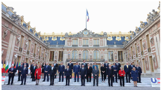
Reunión informal del CE en Versalles, 10-11 de marzo de 2022

Lo ocurrido durante el primer trimestre de 2022 será difícil de olvidar. Desde el comienzo de la invasión se han reunido los líderes de las más importantes organizaciones internacionales relacionadas con la seguridad y la defensa. La primera reacción de la Unión Europea (UE) se produjo el mismo día 24 de febrero en una reunión especial del Consejo Europeo (CE) en la que se condenó con la máxima firmeza la agresión militar sin precedentes de Rusia y se expresó la unidad de la UE con sus socios internacionales, así como su solidaridad con Ucrania. El CE pidió a Rusia que: pusiese fin inmediatamente a sus