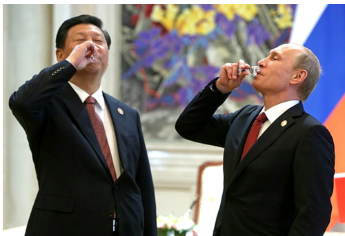
Vladimir Putin y Xi Jinping brindan con vodka en Shanghai en mayo de 2014.

debe de tenerse muy en cuenta a la hora de perfilar las reacciones de Occidente con China en el contexto de la invasión rusa de Ucrania.