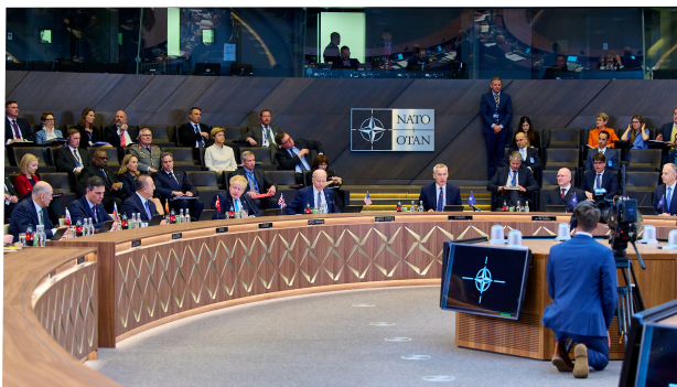
Cumbre extraordinaria de la OTAN, 24 de marzo de 2022

Tras la reunión informal del CE celebrada los días 10 y 11 de marzo, los jefes de estado y gobierno de la UE reunidos en Versalles hicieron una Declaración de la que por su relevancia se copia el primer punto: “Hace dos semanas, Rusia trajo de vuelta la guerra a Europa. La agresión militar no provocada e injustificada de Rusia contra Ucrania viola de manera flagrante el Derecho Internacional y los principios de la Carta de las Naciones Unidas y menoscaba la seguridad y estabilidad europea y mundial. Está causando un sufrimiento indecible a la población ucraniana. Toda la responsabilidad de esta guerra de agresión recae en Rusia y en Bielorrusia, su cómplice, y los responsables tendrán que rendir cuentas por sus crímenes, especialmente por los ataques indiscriminados contra la población y objetivos civiles. A este respecto, acogemos con satisfacción la decisión del fiscal de la Corte Penal Internacional de abrir una investigación. Pedimos que se garantice inmediatamente la seguridad y la protección de las instalaciones nucleares de Ucrania con la asistencia del Organismo Internacional de Energía Atómica. Exigimos que Rusia ponga fin a sus acciones militares, retire todas las fuerzas y equipos militares de la totalidad del territorio de Ucrania, de manera inmediata e incondicional, y respete plenamente la integridad territorial, la soberanía y la independencia de Ucrania dentro de sus fronteras reconocidas internacionalmente.”