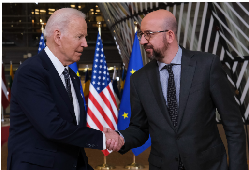
El presidente Michel recibe al presidente Biden

En las Conclusiones del Consejo Europeo de 24 y 25 de marzo se condenó muy duramente la invasión rusa de Ucrania. Además, se pidió a Rusia que con urgencia garantizase el paso seguro de civiles situados en zonas de combate. En el documento se asegura que la UE continuará proporcionando a Ucrania apoyo coordinado tanto político, como financiero, material y humanitario y se reconocen los esfuerzos realizados para acoger a refugiados. También se pidió a todos los Estados miembros que intensifiquen la acogida con espíritu de unidad y solidaridad y se invitó a la Comisión a aumentar su actividad para facilitar la acogida. Para la reconstrucción de una Ucrania democrática cuando terminen los ataques rusos se acordó desarrollar un Fondo Fiduciario de Solidaridad.