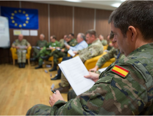
EU Battle Group Planning Exercise Hosted by EU Navfor Personnel /Eunavfor

Los EU Battlegroups son unidades es de unos 1.500 efectivos cada uno, para responder a situaciones de crisis o amenaza, su organigrama es multinacional y su liderazgo rota semestralmente. Con estos Battlegroups la UE puede realizar dos despliegues de respuesta rápida durante un mínimo de 30 días, ampliables hasta 120 con reservas y reabastecimientos.