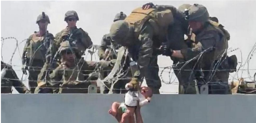
Un bebé sujetado por miembros del ejército americano supera el perímetro del muro del aeropuerto de Kabul