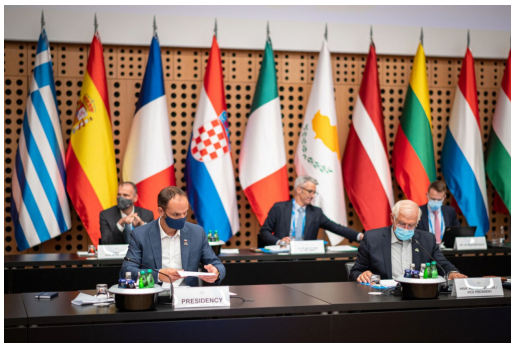
El ministro de Exteriores de Eslovenia, Anze Logar (izquierda) y el Alto Representante para Asuntos Exteriores de la UE, Josep Borrell, en primer plano, durante la reunión informal de ministros de Exteriores de la UE, en Kranj (Eslovenia).

Les mentiría si les dijera que hoy todo el mundo ha estado de acuerdo en ello de forma explícita, pero no importa porque no era una reunión para tomar decisiones, sólo un debate. La auténtica decisión se adoptará en noviembre. Espero que la discusión que hemos empezado sobre la Brújula Estratégica haya creado el suficiente entendimiento como para movilizar la voluntad de los Estados miembro”. Subrayó que Biden, es el tercer presidente tras Trump y Obama,